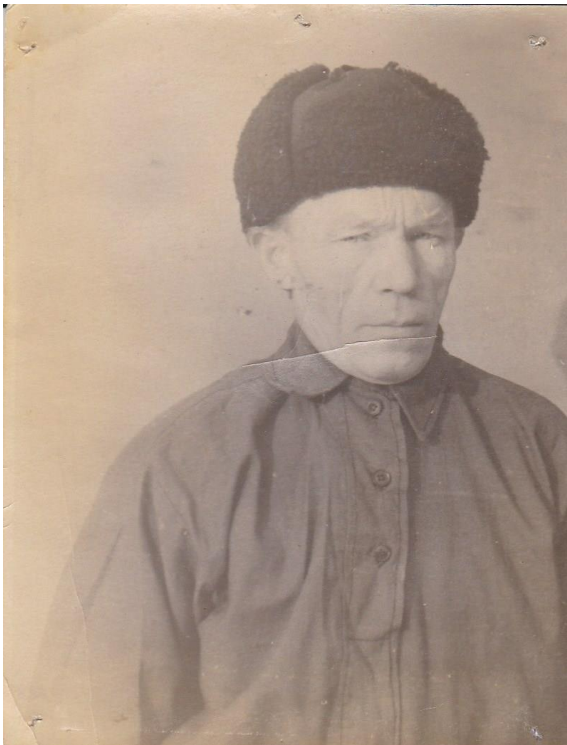
ДМИТРИЕВ АНАТОЛИЙ ПАВЛОВИЧ 1911 –