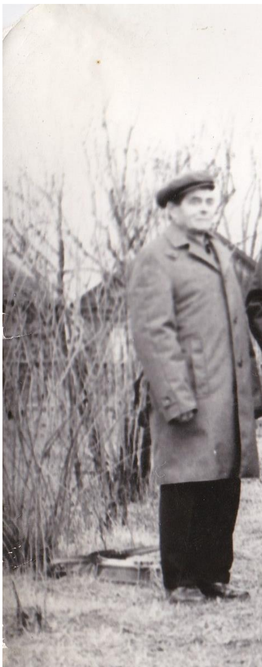
СМИРНОВ НИКОЛАЙ АЛЕКСЕЕВИЧ 1916 –