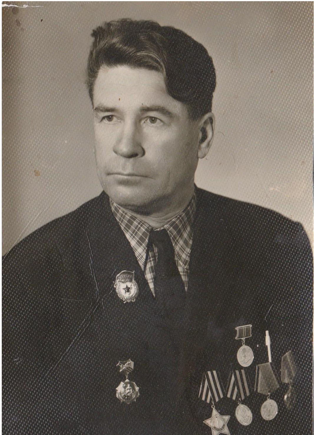
ЛЕБЕДЕВ АЛЕКСАНДР ИВАНОВИЧ 1923